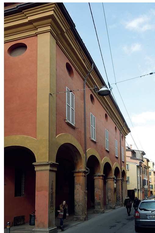
A Magyar–Illír Kollégium (ma: Collegio Venturoli ), via Centotrecento

Erre az időre tehető a refektórium máig fennmaradt freskódíszítése, Gioacchino Pizzoli bolognai festő műve. Magyar és horvát nemzeti szent uralkodókat és főpapokat ábrázol, a mennyezeten pedig azt a jelenetet, mikor Zvonimir horvát király özvegye, Ilona halálos ágyán öccsének, László magyar királynak örökségképp átadja Illíria koronáját. 12 Az Archiginasio címerábrázolásaihoz hasonlóan a földszinti és emeleti ár-